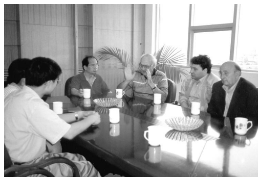
6 月 18 日意大利专家来我公司参观考察

此外, 《圣和通讯》的电子邮箱已经设定: NEWSSH@SINA.COM , 欢迎大家投稿。