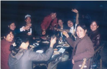
觥筹交错放飞的情

懒惰之人的一个重要特征就是拖沓。把前天该完成的事拖延到后天，是一种很坏的生活习惯。对一个渴望成功的人来说，拖延是最具破坏性，也是最危险的恶习。它使人丧失进取心。一旦开始遇事拖延，就很容易再次拖延，直到变成一种根深蒂固的习惯。解决拖拉的唯一良方就是行动。当你开始着手做任何事时，你就会惊讶的发现，自己的处境正迅速地改变。