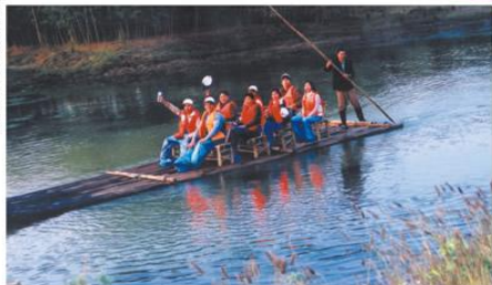
纵情双溪上，逸然山水间