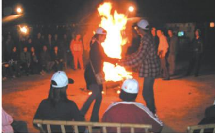
熊熊篝火舞动的心