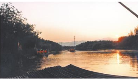
莫道夕阳晚，竹海乐翻天